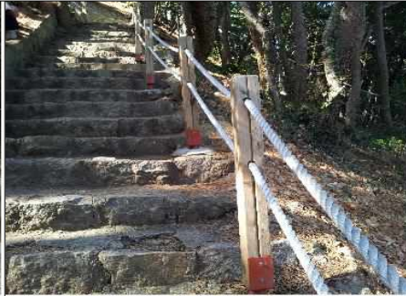
○○○(등대방향) 난간대 고정불량