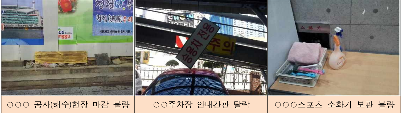
○○○ 공사(해수)현장 마감 불량