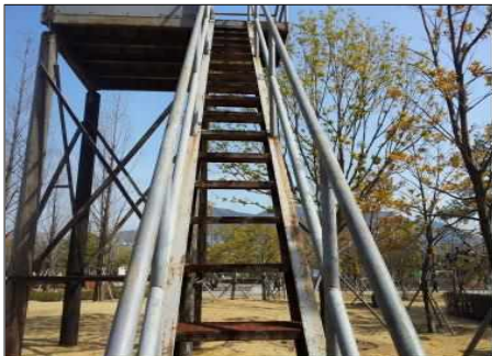
초소 계단 부식 미관저해