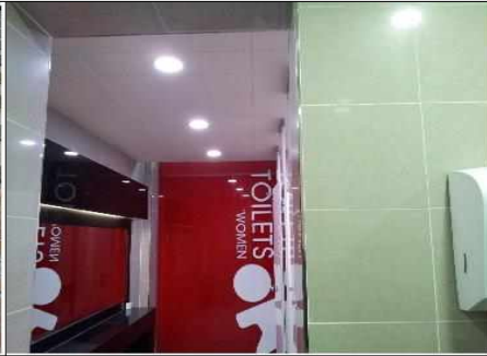
휴관시 미 이용시설 조명 점등 상태