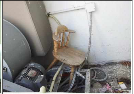
덤웨이터 주위 환경정리 불량