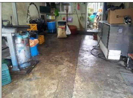
○○공원 음식물 처리실 환경 불량