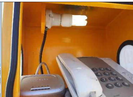
비상통화함 조명 소등(주간) 필요