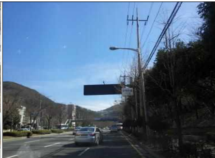
○○터널 교통상황 안내판 고장