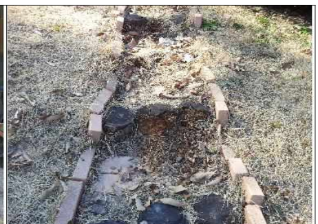
○○공원 옥외창고 뒤 계단 파손