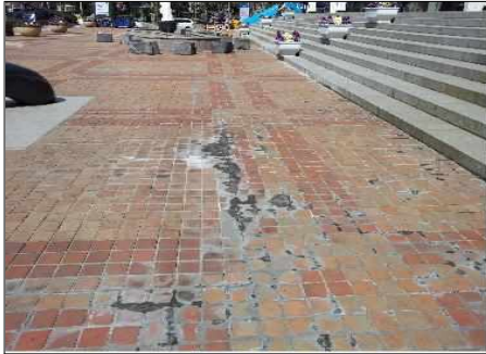
대강당 앞 바닥 백화발생