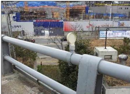
○○로 시선유도표지 노후