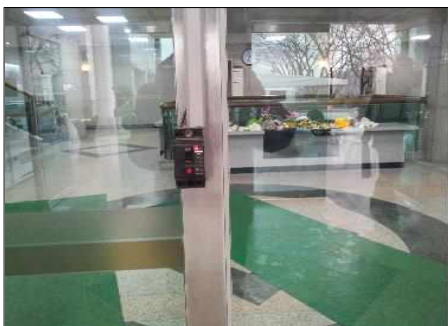
제2○○원 미사용 전기 방치