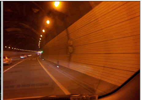
○○터널 LED 안내판 고장