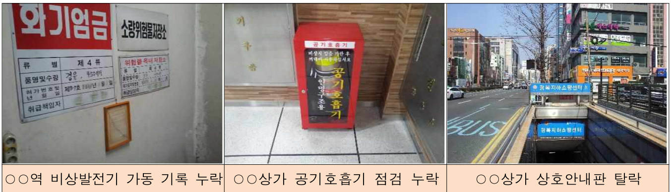
○○역 비상발전기 가동 기록 누락