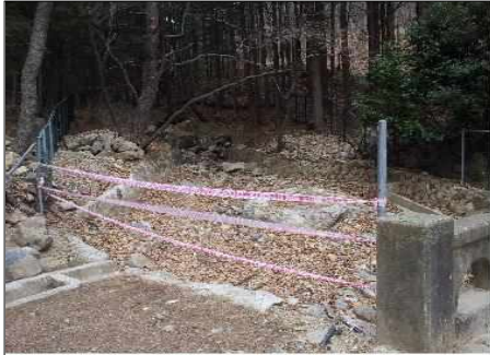
○○○ 바람고개 계곡 석축 탈락