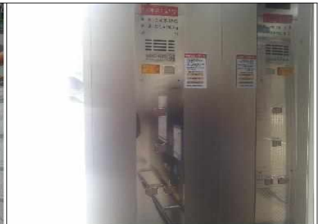
○○○광장 E/L 안전필증 미부착