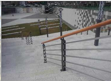
○○○광장 난간대 흔들림 현상