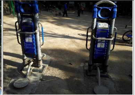
○○공원 운동기구 작동 불량